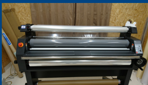
ワイドフォーマットラミネーター X-TREME 54W

インクジェットで出力したシートを保護する為シート表面に透明なシートを貼り付ける機械です。